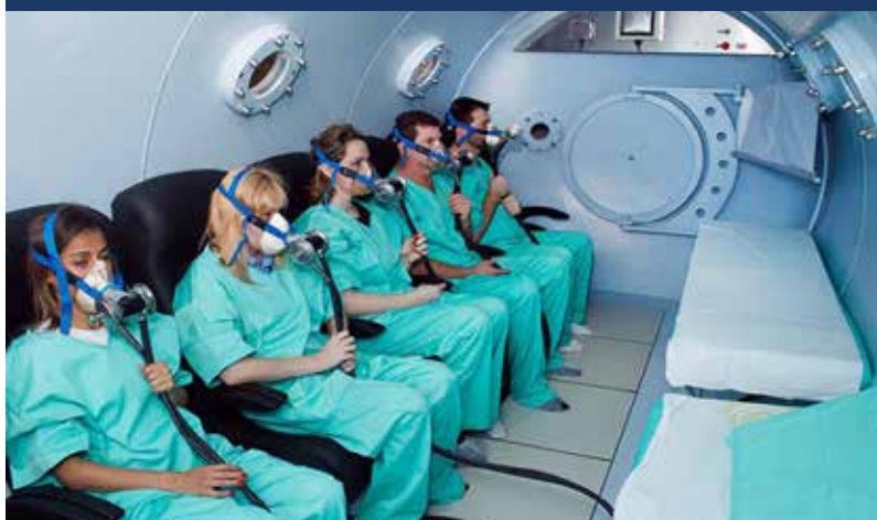
Figura 1: Câmara Hiperbárica Multipaciente.